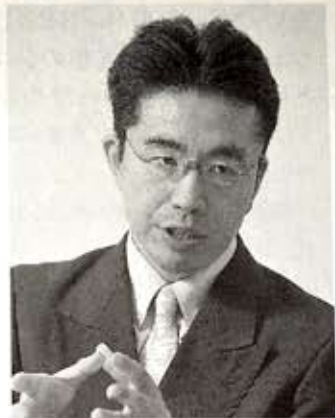
75年生まれ。真宗大谷派の僧侶。寺ネット・サンガ、葬送支援ネットワークの代表として貧困や自殺、孤独死の問題に取り組む。